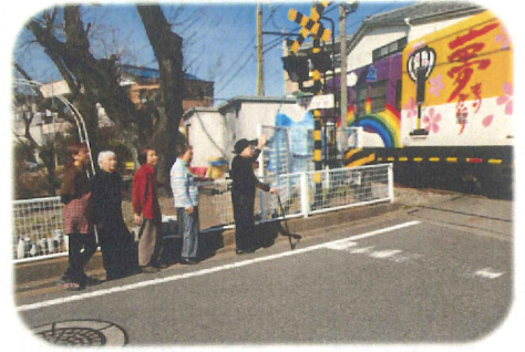
お弁当を作って近所の公園へお花見に行ってきました（^-^）